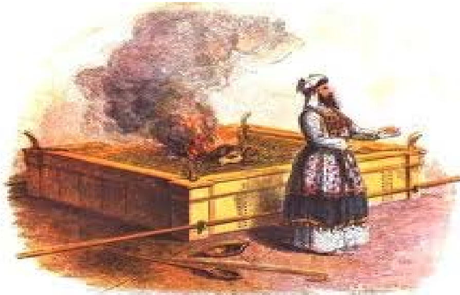
THE ALTAR OF BURNT-OFFERING.

Όμως, για ξεκινήσει η ανοικοδόμηση πρέπει πρώτα να ξεκινήσουν από το θυσιαστήριο, (Εσδ. 3:1-7). Το χάλκινο θυσιαστήριο (Εξοδ. 27:1-4) έπρεπε να έχει κάποιες λεπτομέρειες, (Εβρ. 8:5) «Πρόσεχε να τα κάνεις όλα σύμφωνα με τον τύπο που σου δείχθηκε στο βουνό».